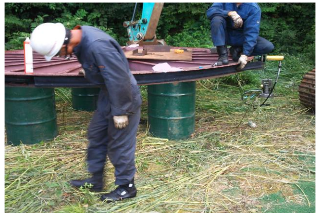
折返し滑車ライナー交換