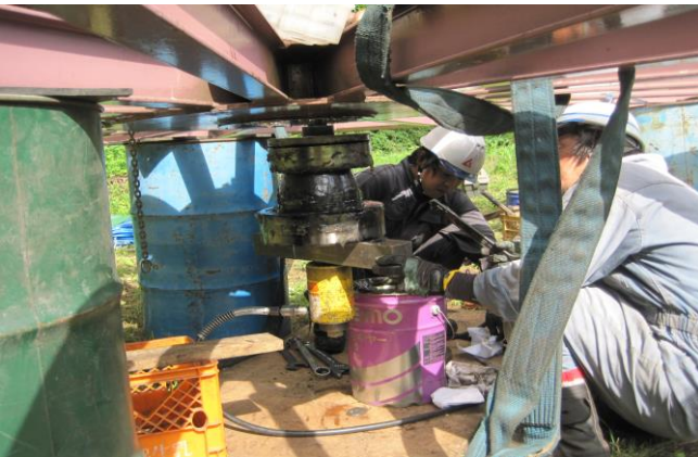
折返し滑車ベアリング交換